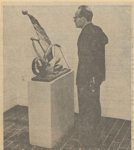
Den kunstinteresserede betragter Hørrups skulpturmodel 'Døden hæster'.