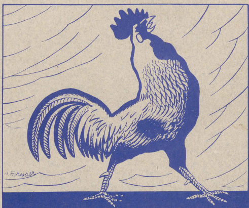
C à grain